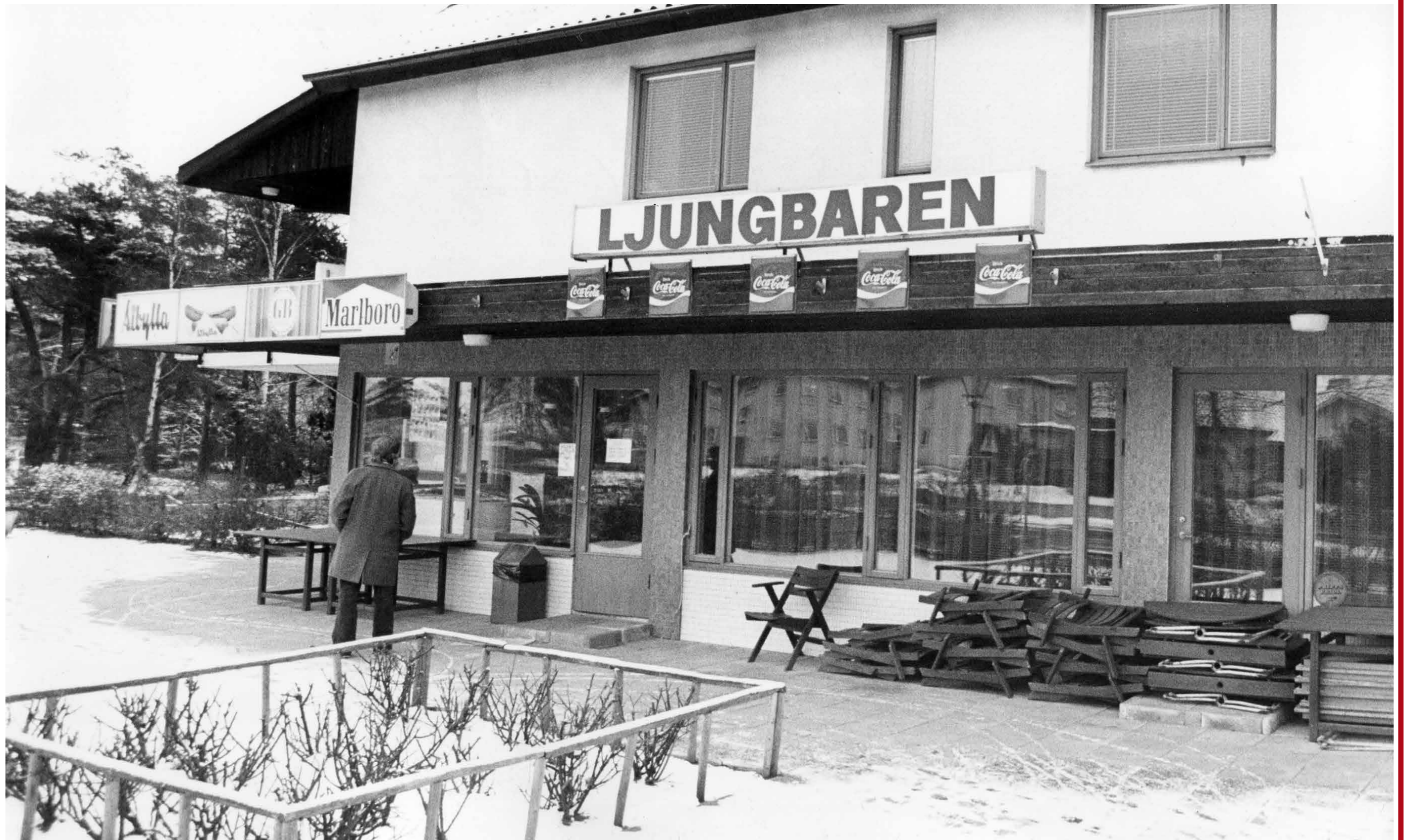
Ljungbaren 1976. Nu, sedan länge, restaurang Lotus House.