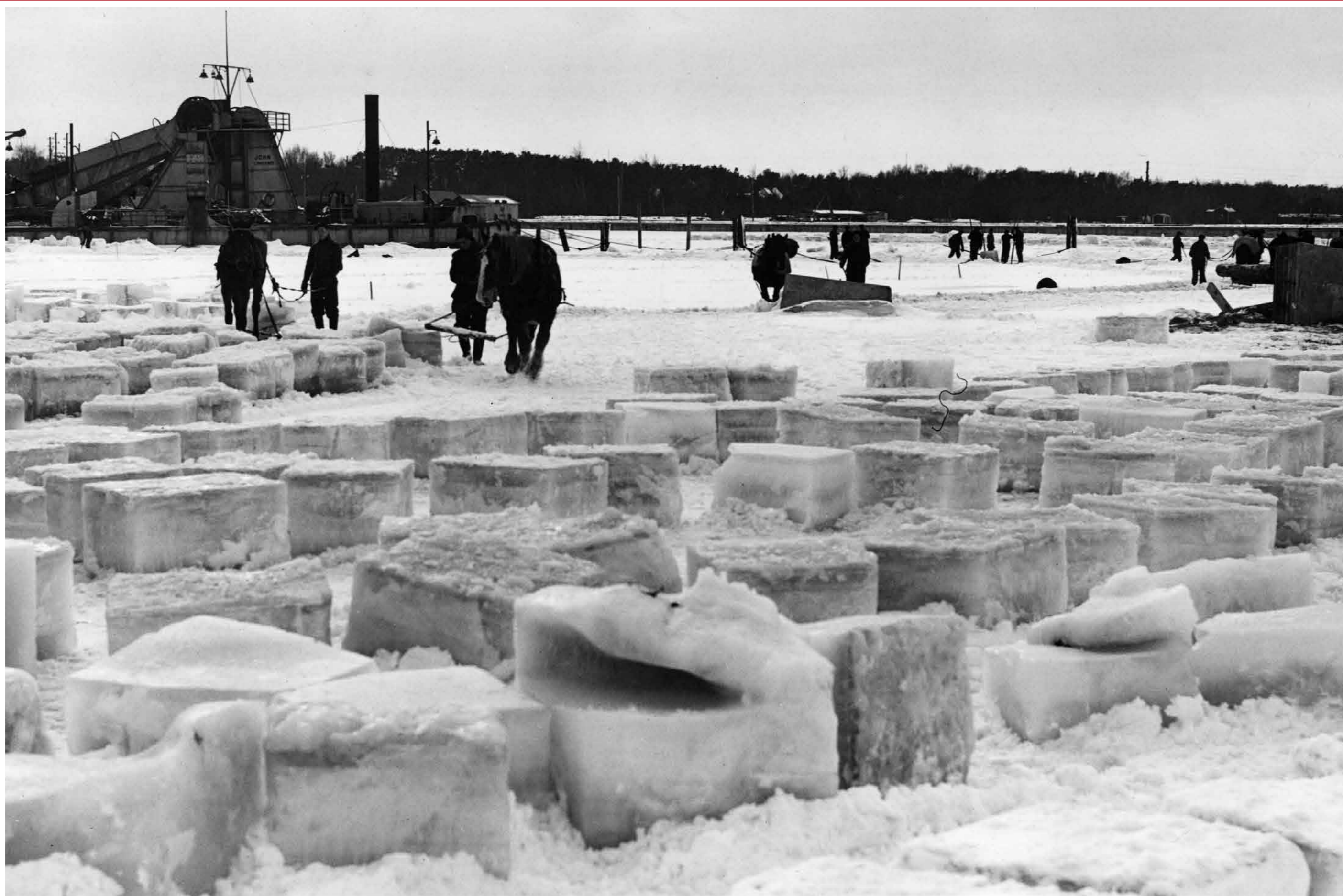
Is sågas upp på den ännu inte färdiga Falsterbokanalen före kylskåpens tid 1941.