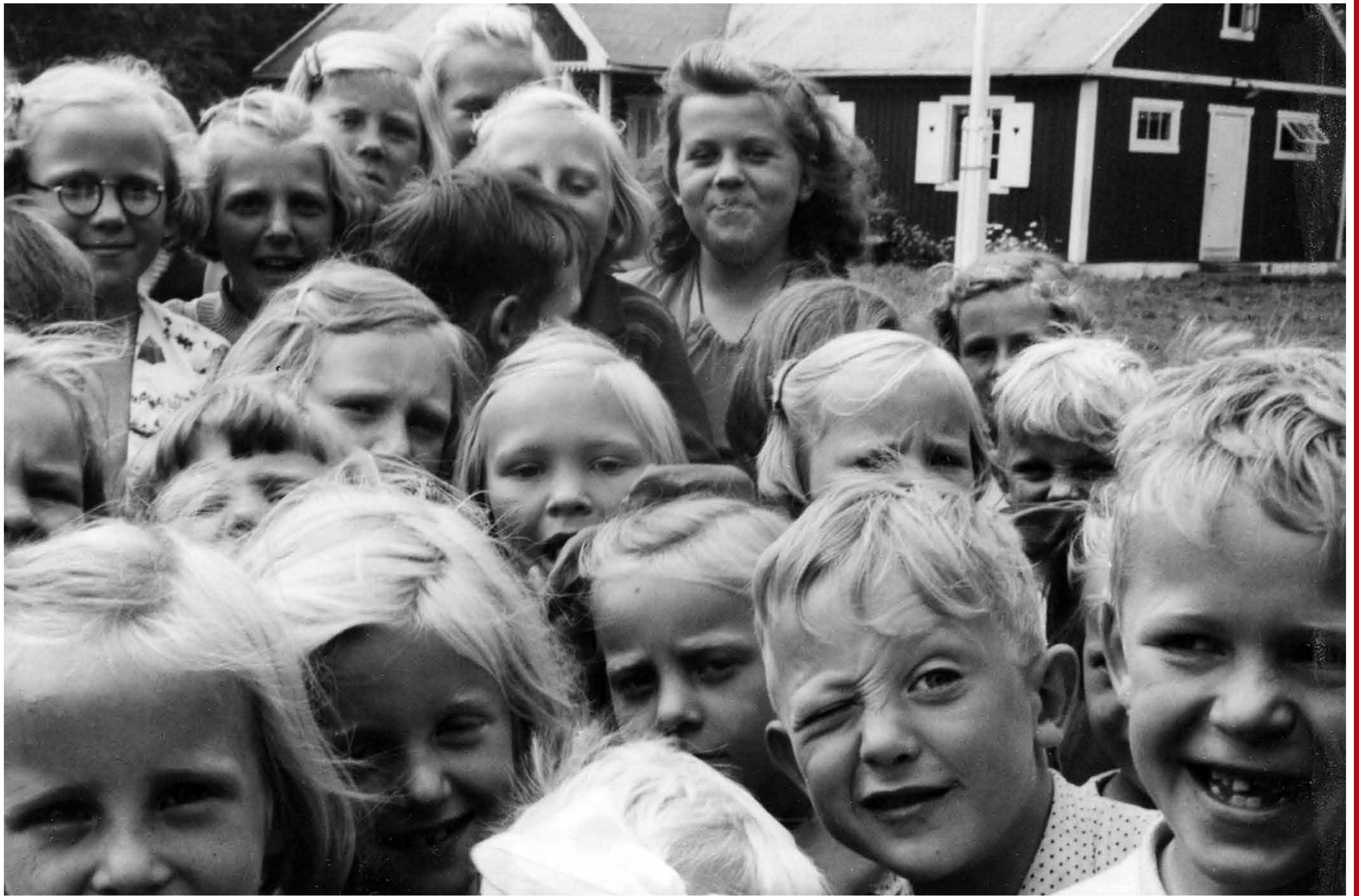
Barn från Malmö på sommarkoloni i Höllviken sommaren 1943.