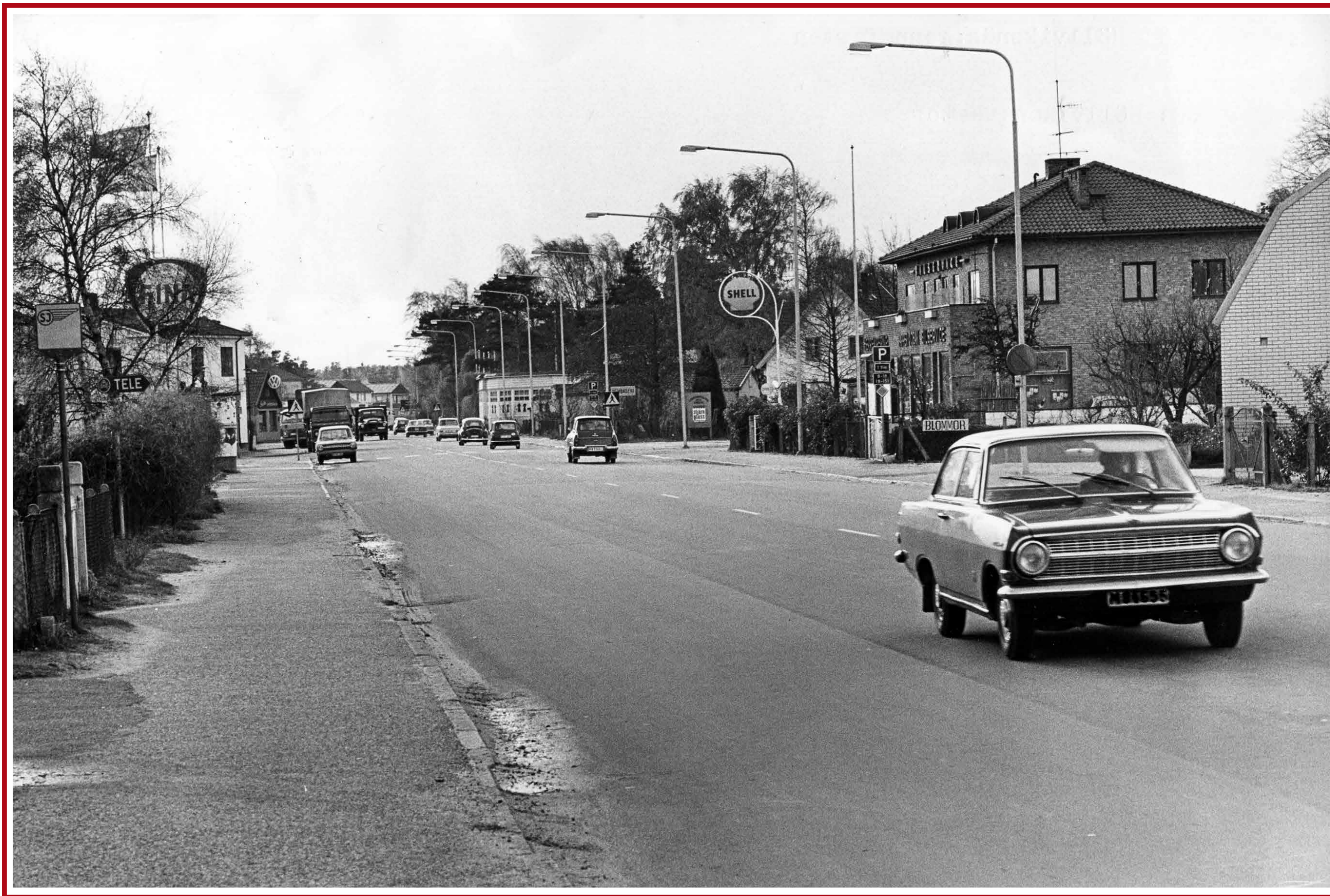
Bensinmackar i Höllviken 1973.