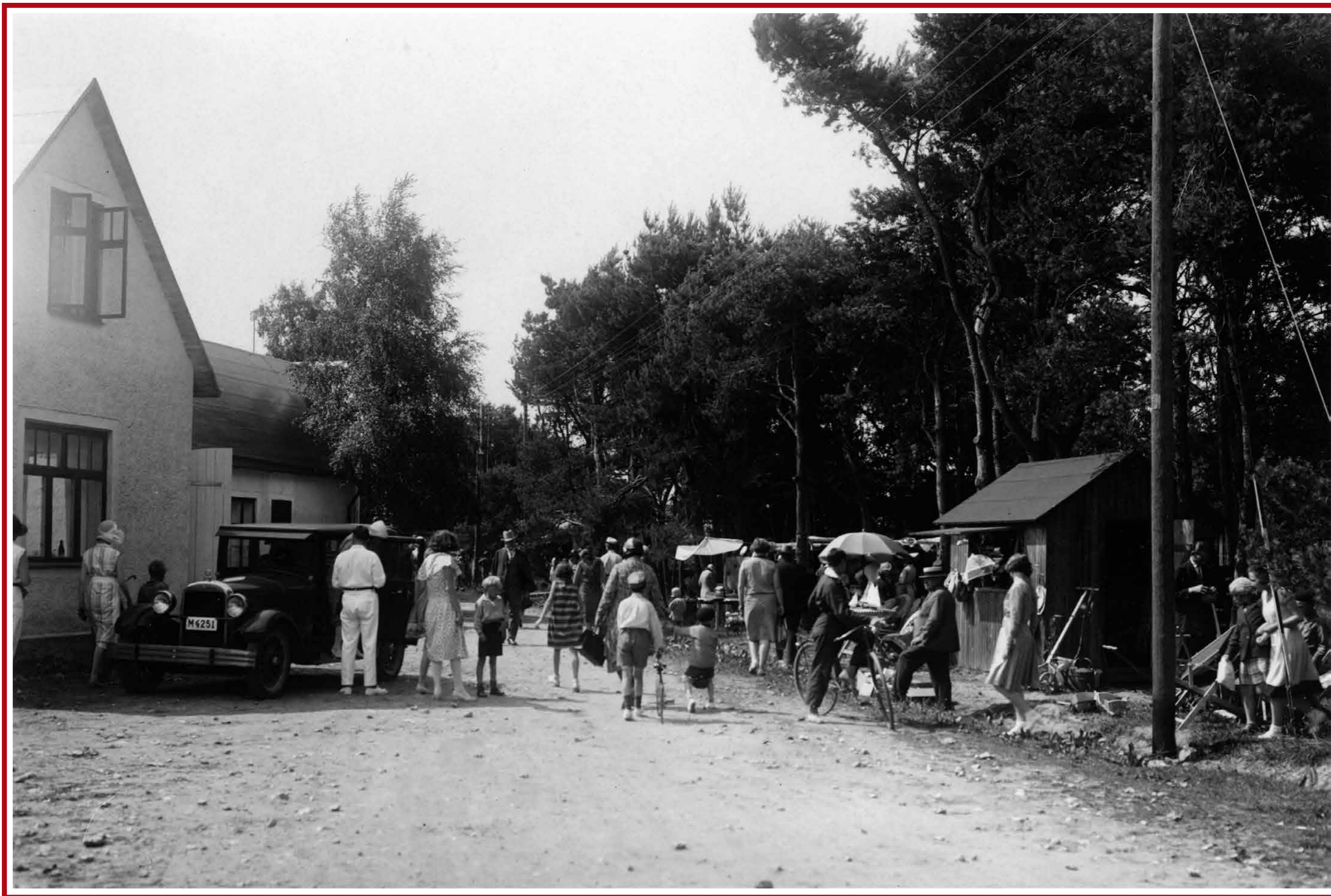
Höllvikens första torg vid »Tages« speceriaffär vid Möllevägen. 1930-talet