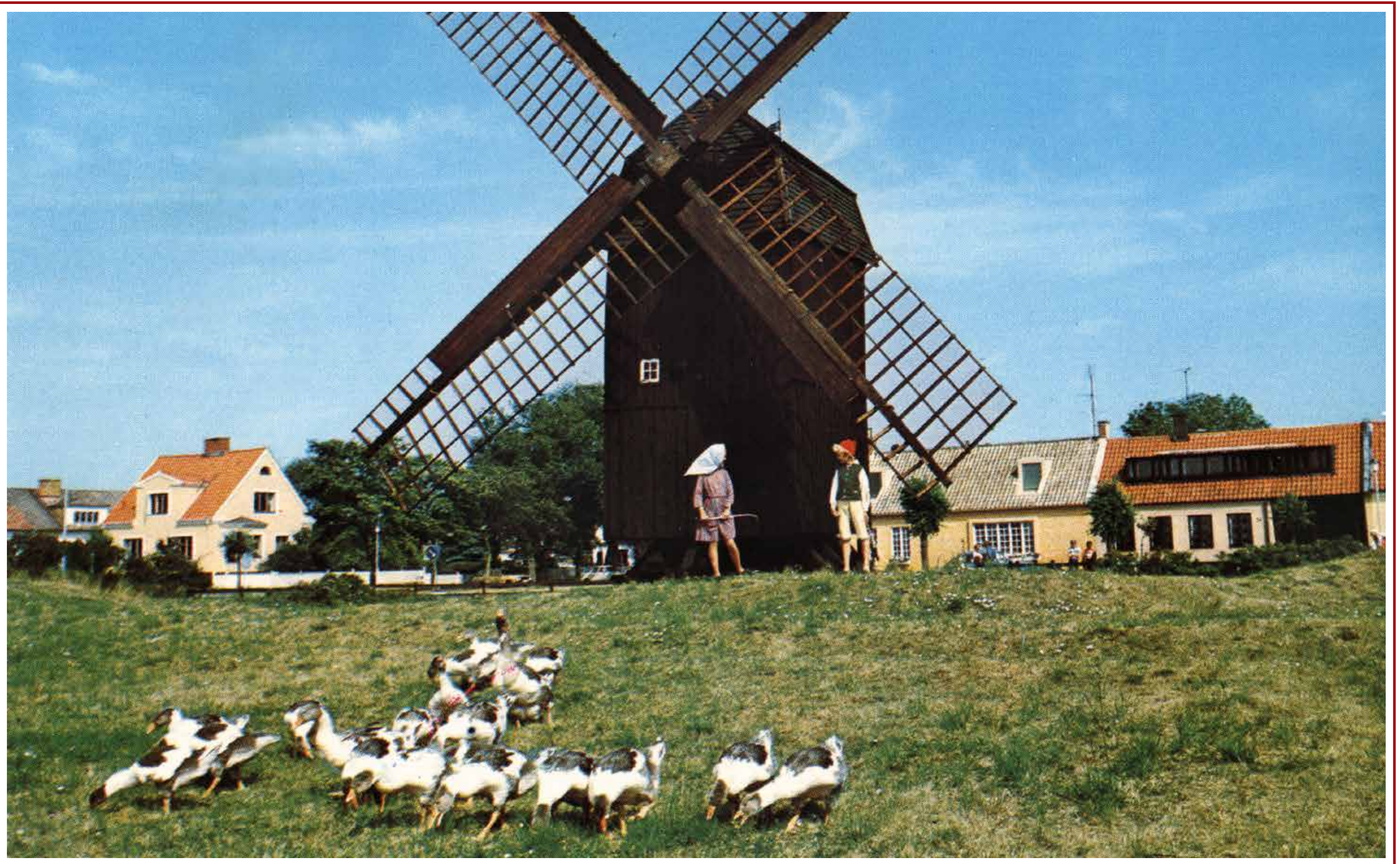
Gåsapågar och gåsapigor finns bland annat avbildade på vykort, askkoppar, spelkort, vimplar, kartor och i broschyrer.