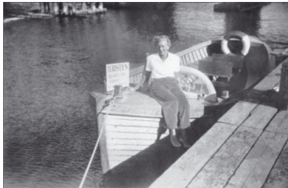
Ovan och nedan till vänster: Rundtursbåten »Turisten«.