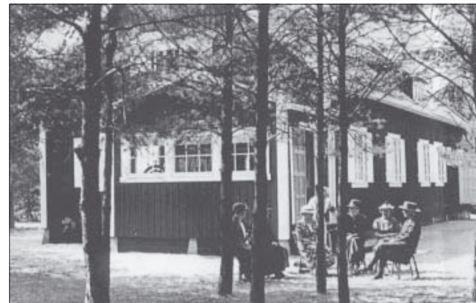
Styrelsen på besök 1930.

Man hade inga föräldrabesök och ingen övrig kontakt med hemmet var nödvändig ansågs det. Flera barn var sängvätare och varje natt vid 24-tiden väcktes alla barnen upp, då var det »kissetid«.