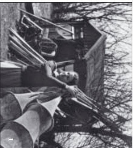
1. Görens fiskerikapskaphytt vid Öresundsstämman.