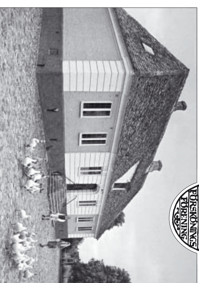
Twillingarna Eva och Per Fridlund vallar gässen omkring 1980.