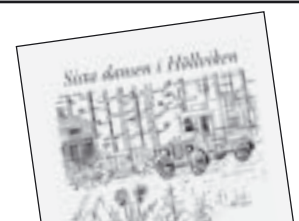
Sista dansen i Höllviken av Anders Carlsten 105 kr.