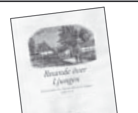
Resande över Ljungen av Christian Kindblad 90 kr.