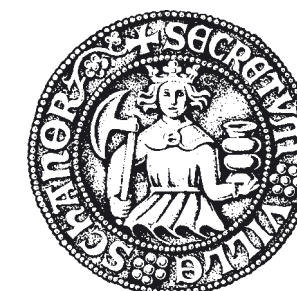
Rekonstruktion av Skanörs äldsta kända sigill från 1300-talet.

Rådhusorget i Skanör omkring hundra år efter händelserna i artikeln.