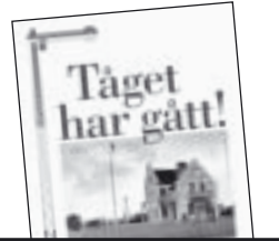
Tåget har gått! av Christian Kindblad 50 kr.