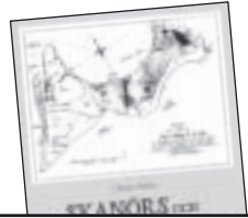
Skanör och Falsterbos historia från A till Ö av Christer Melin 95 kr.