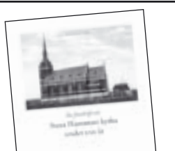
Stora Hammars kyrka 100 år av Ingemar H. Johansson 50 kr.