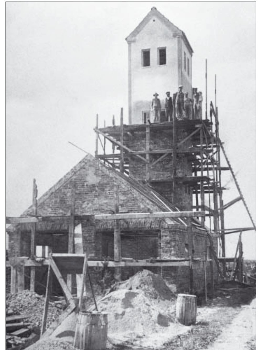
Höllvikens gamla brandstation under byggnad 1932. Tornet var 15 meter högt och avsett för torkning av slangar.