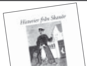
Historier från Skanör av Anders Carlsten 130 kr.