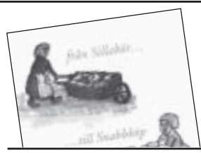
Från Sillabör till Snabbköp av Ingemar H. Johansson och Christian Kindblad 160 kr.