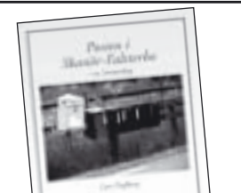
Posten i Skanör och Falsterbo av Lars Dufberg 80 kr.