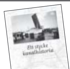
Ett stycke kanalhistoria av Sven Lundström m.fl. 45 kr.