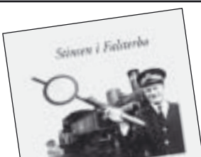
Stinsen i Falsterbo av Stig Mårtensson 125 kr.