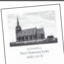
Stora Hammars kyrka 100 år av Ingemar H. Johansson 50 kr.