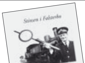
Stinsen i Falsterbo av Stig Mårtensson 125 kr.