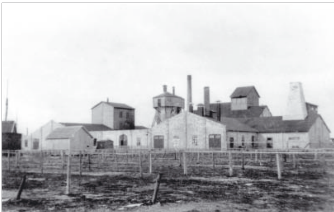
Fabriken fullt utbyggd. Vattentornet i mitten och runt om byggnader för ånggenerator, bränning av cement, malning av kalkmjöl med mera. Hamnkontoret skymtar till vänster.