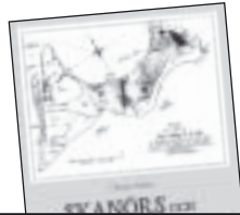
Skanör och Falsterbos historia från A till Ö av Christer Melin 95 kr.