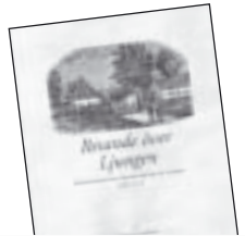
Resande över Ljungen av Christian Kindblad 90 kr.