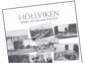
Höllviken - bilder och minnen från förr 125 kr.

På Ljungen ges ut av KULTURFÖRENINGEN CALLUNA