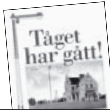
Tåget har gått! av Christian Kindblad 50 kr.