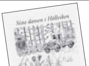
Sista dansen i Höllviken av Anders Carlsten 105 kr.