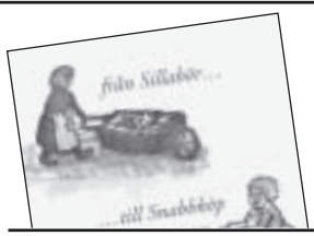
Från Sillabör till Snabbköp av Ingemar H. Johansson och Christian Kindblad 160 kr.