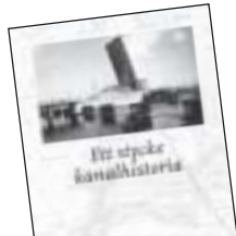
Ett stycke kanalhistoria av Sven Lundström m.fl. 45 kr.