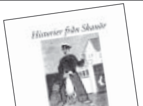
Historier från Skanör av Anders Carlsten 130 kr.