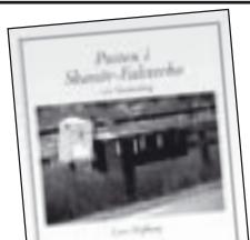
Posten i Skanör och Falsterbo av Lars Dufberg 80 kr.