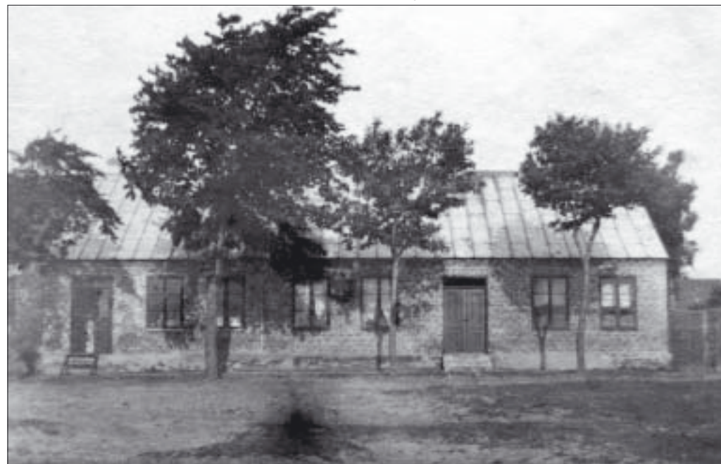
Östergatan 51-53 i Skanör.

Han deltog även vid byggandet av de nya villorna på »grevens ljung«, dvs. Ljungskogen, i samband att järnvägen kom 1904.