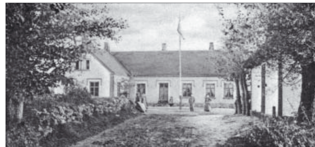
Skolan i Kämpinge

För oss barn var havet vidunderligt, med olika skiftningar från dag till dag. Vid hori-