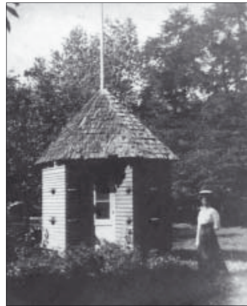
Bikupan utan gubbar, damen är oss tyvärr okänd.