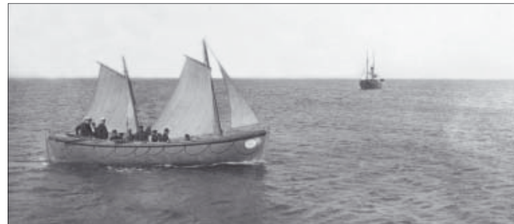
Livräddningsbåten med lotsbåten »Snopp« i bakgrunden.

Eftersom Falsterbo och Skanör var kustorter, och ett farligt rev låg utanför, var sjöfartsolyckor mycket vanliga. När därför en livräddningsstation upprättades vid lotsplatsen i Skanör, beslöt man att införskaffa en livbåt och man byggde en stationsbyggnad för den. Den hade betäckningen »Lifbåt 416« och inköptes från England. Båten konstruerades 1852 och byggdes 1880-1882. Den levererades till Helsingborg 1882, men kom till Skanör först mellan 1896 och 1898. Båten låg på en hjulvagn, drogs av fyra hästar och krävde 13 mans besättning. Om båten skulle ta sig sjövägen till olycksplatsen, skulle det i många fall ta för lång tid. Det första ingripandet skedde för att rädda besättningen på den norska briggen Wilhelma. Lifbåt 416 tjänade i många år, men 1942 ersattes den med en motordrivna båt som stationerades i Skanörs hamn. 1946 deponerades den till Falsterbo museum. Där fick den stå utomhus i många år och genomgick ett omfattande förfall. Först 1991 togs beslut om att man skulle göra en behövlig restaurering. Arbetet utfördes av Lindhs Båtbyggeri HB i Smygehuk, och när Falsterbokanalens nya bro invigdes 1992, roddes Lifbåt 416 som första båt genom kanalen av sitt nybildade »Skanör-Falsterbo Lifbåtsroddare Lag«. Livräddnings-