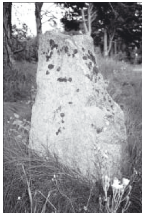
Stenen vid korsningen Bergs väg och Solidenvägen.

Året därpå satta byarna upp var sin gränssten längs det som numera motsvarar Bergs väg. Två står kvar, en sten hamnade på Falsterbo museum under 1960-talet och den fjärde – den jag letat efter – finner man ned-