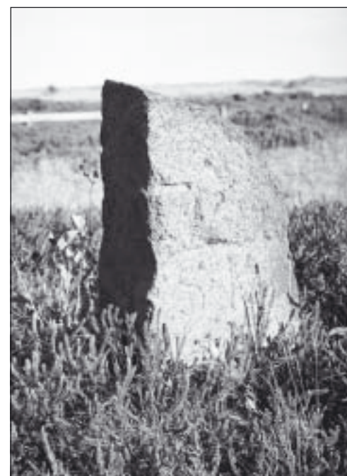
Denna sten står på golfbanan i Ljunghusen.

Sommar fortsätter: »Närvarande Byamän kunde häremot så mycket mindre förmås till någon årkänsla af thenne Herr Borgmästarens emot them viste stora gunst och bevägenhet, som the påminde sig, dels at hufvudfrågan ännu ligger under en Respective Domstols pröfning, dels ock at the många å samma mark ännu synbare teckn et fåror, höjder och