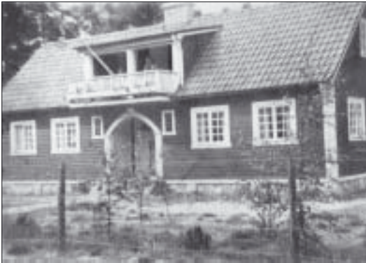
R. F:s stuga å Ljungen.