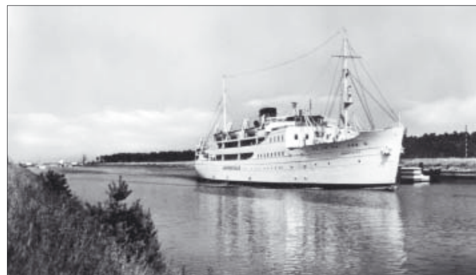
Den ståtliga »M/S Rotna« går genom kanalen på 50-talet. Fram till 1967 gick hon tillsammans med »66-selskabet« övriga båtar »Hammershus«, »Bornholm«, »Kongedybet« och »Østersøen« mellan Köpenhamn och Rønne.