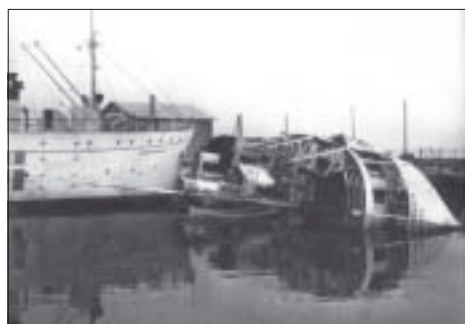
»Östbornholm« ligger skadad i Nexö hamn. Till vänster »Nordbornholm« med den danska flaggan målad på sidan. Nedan lämnar tyskarna ett bombat Rønne.