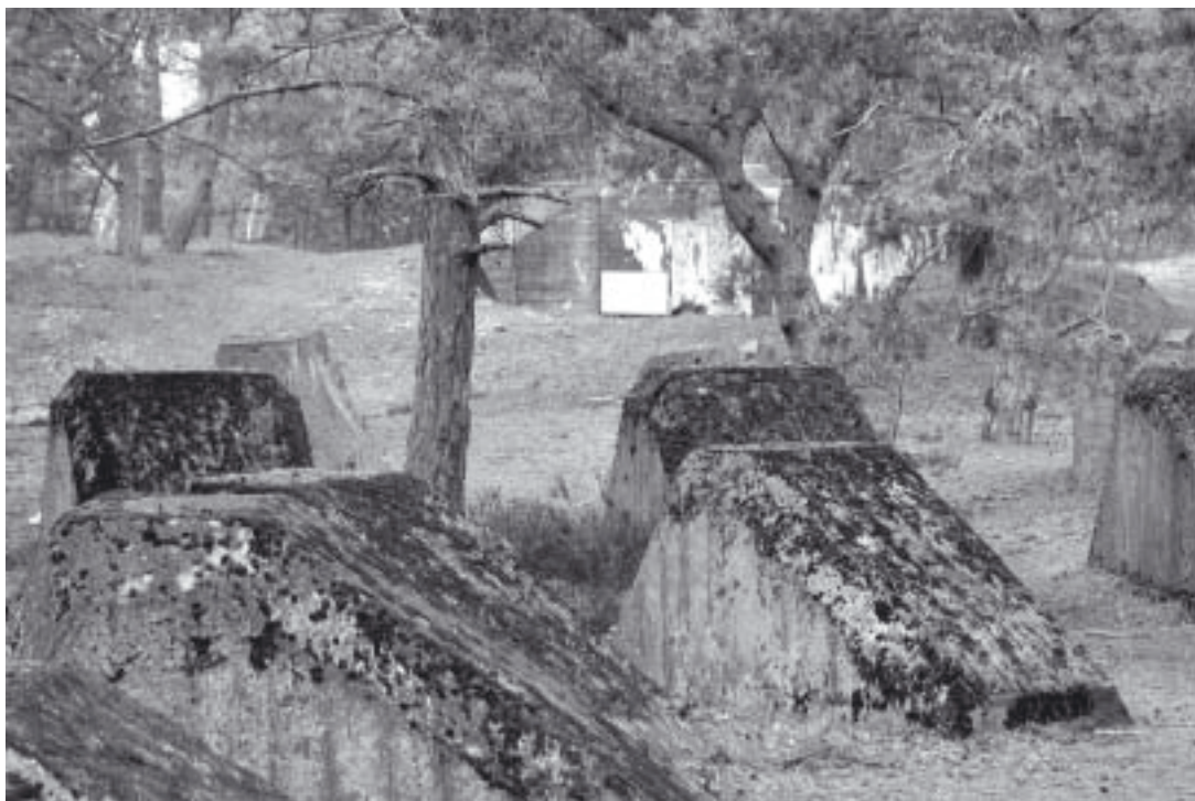
Spärrblock vid Falsterbokanalens.

Längs Falsterbokanalens »landsida« vandrar man verkligen i det militära kulturlandskapet.