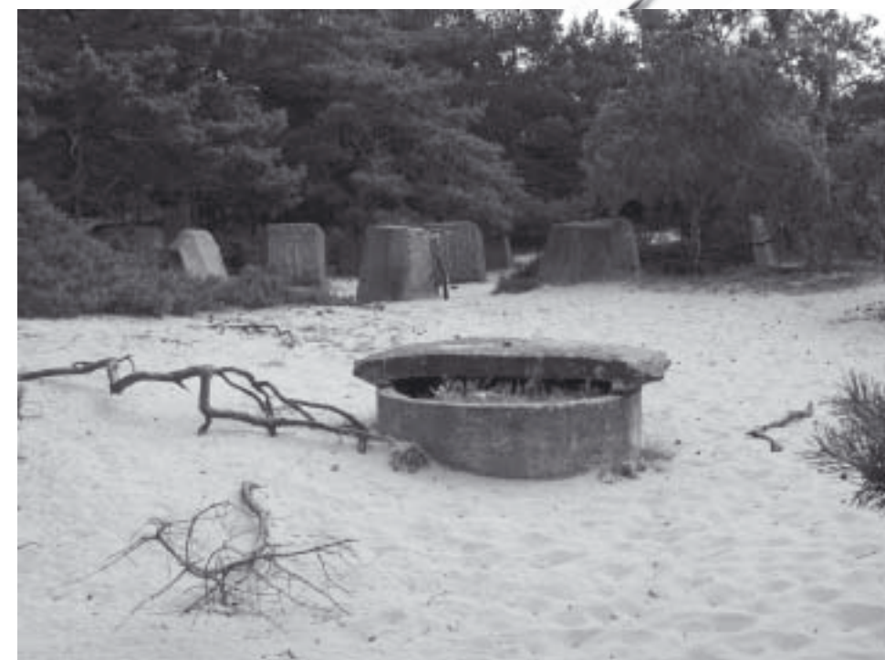
Nedan: Skyttevärn av runt cementrör.