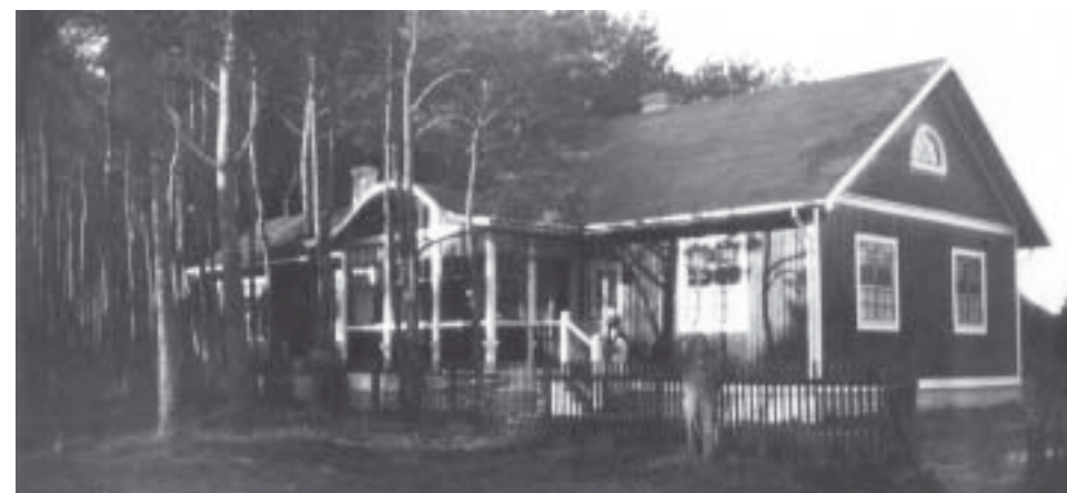
Den röda stugan på Störvägen.