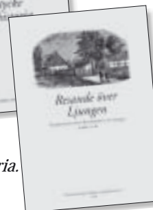
Resande över Ljungen. Pris 75 kr.