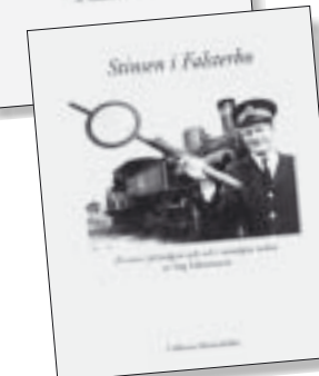
Stinsen i Falsterbo. Pris 140 kr.