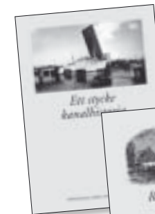
Ett stycke kanalhistoria. Pris 50 kr.