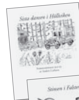
Sista dansen i Höllviken. Pris 130 kr.